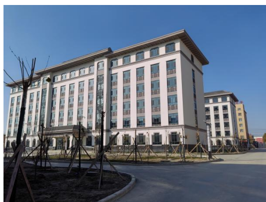
宿舍楼 2 栋(男生宿舍+女生宿舍)