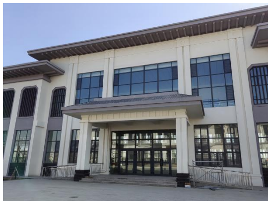
风雨操场+多功能阶梯教室