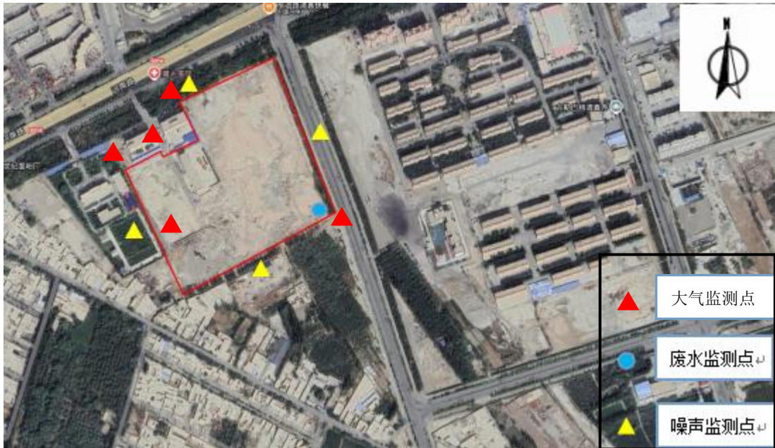
图 4 监测点位示意图